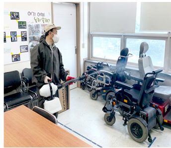
코로나19 정기 방역 소독