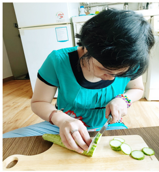
2. 재료 손질 후 음식 조리하기