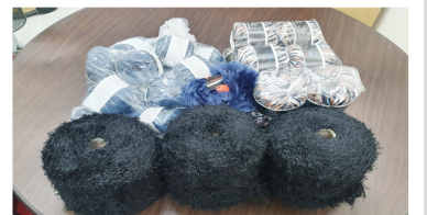
한국장애인자립생활센터 (마스크) 굿잡CIL (뜨개실)