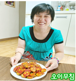
3. 요리완성 >미</p></div>