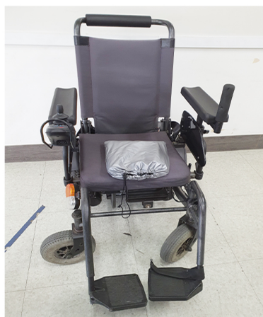
이찬훈 (전동휠체어) | 강일수 (휠체어커버)