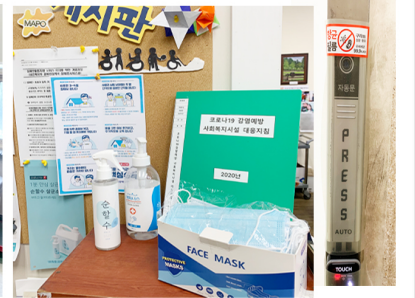
코로나19 방역용품 및 대응지침 비치