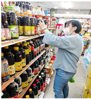
1. 식자재 직접 살펴보고 구입하기