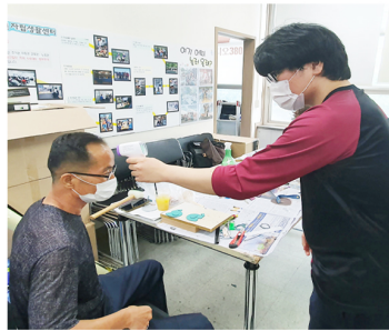
직원 및 방문자 체온 측정